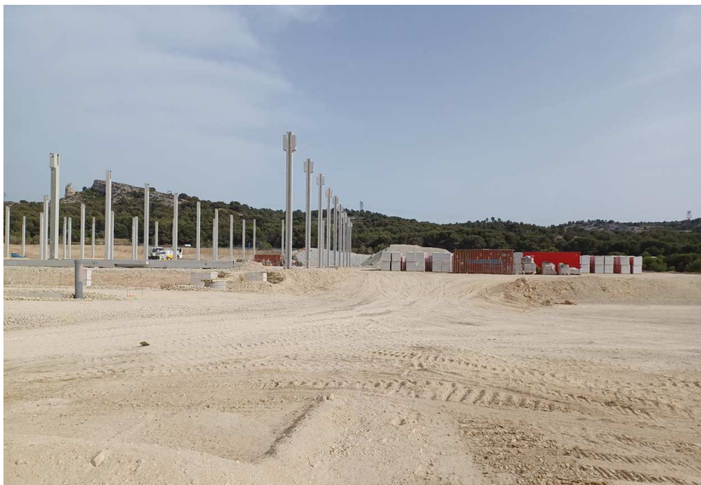
30 mètres de la façade Nord en face de la limite de la cellule 3

Les photographies ci-dessous ont été prises en juin 2022. Tel que le montrent ces photographies, le lot H est actuellement en construction.