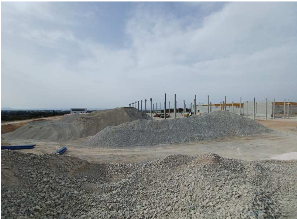
Au sud sur le talus au niveau de l'autoroute en face de la future cellule 4.