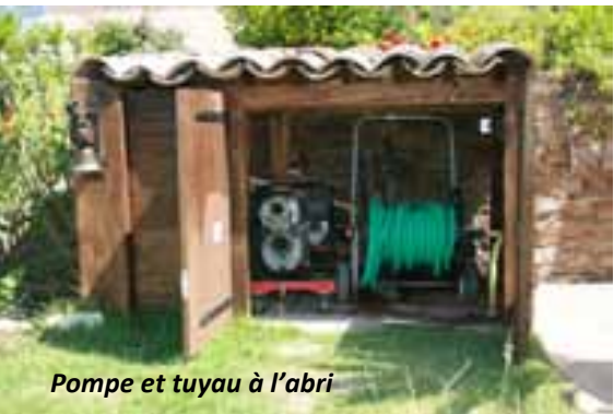
Pompe et tuyau à l'abri