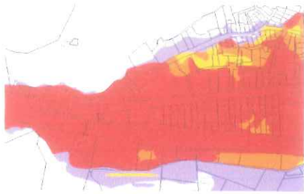
Localisation des parcelles objet de la demande de la municipalité d'Auriol

Définition des enjeux : les parcelles se situent en autres zones urbanisées (orange sur la carte ci-dessus) car les terrains supports de la remarque ne sont constitués que de grand jardin et de maisons, de villa d'habitation anciennes sans mixités ni continuité, ni densité forte.