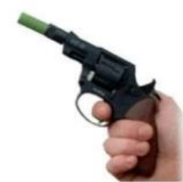
Pistolet d'alarme lanceur de fusées aviaires