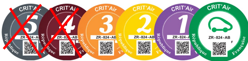
Vignettes Crit'Air autorisées pour les véhicules légers

Les restrictions de circulation envisagées dans le cadre de cette mesure pour les deux roues, les véhicules légers et les poids-lourds, se font sur la base des vignettes Crit'Air. Vous pouvez les commander sur le site gouvernemental : https://www.certificat-air.gouv.fr/