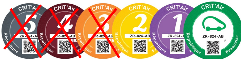
Vignettes Crit'Air autorisées pour les véhicules poids-lourds.

En conséquence, les 17 et 18 juin 2022 de 6h00 à 20h00, la circulation des véhicules légers, y compris les deux roues, de classe 4, 5 et non classés ainsi que des poids-lourds de classe 3, 4, 5 et non classés est interdite par arrêté dans le périmètre du bassin de vie d'Avignon, soit 20 communes de Vaucluse, du Gard et des Bouches-du-Rhône : les communes du Grand Avignon et les communes de Barbentane, Châteaurenard, Noves et Rognonas.