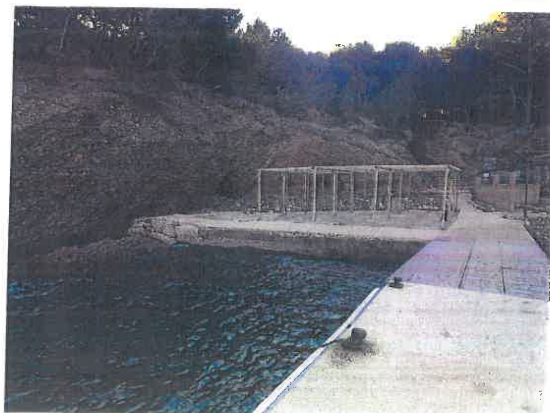
23 janvier 2018