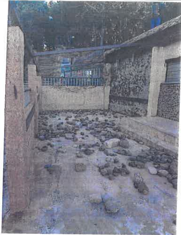
23 janvier 2018