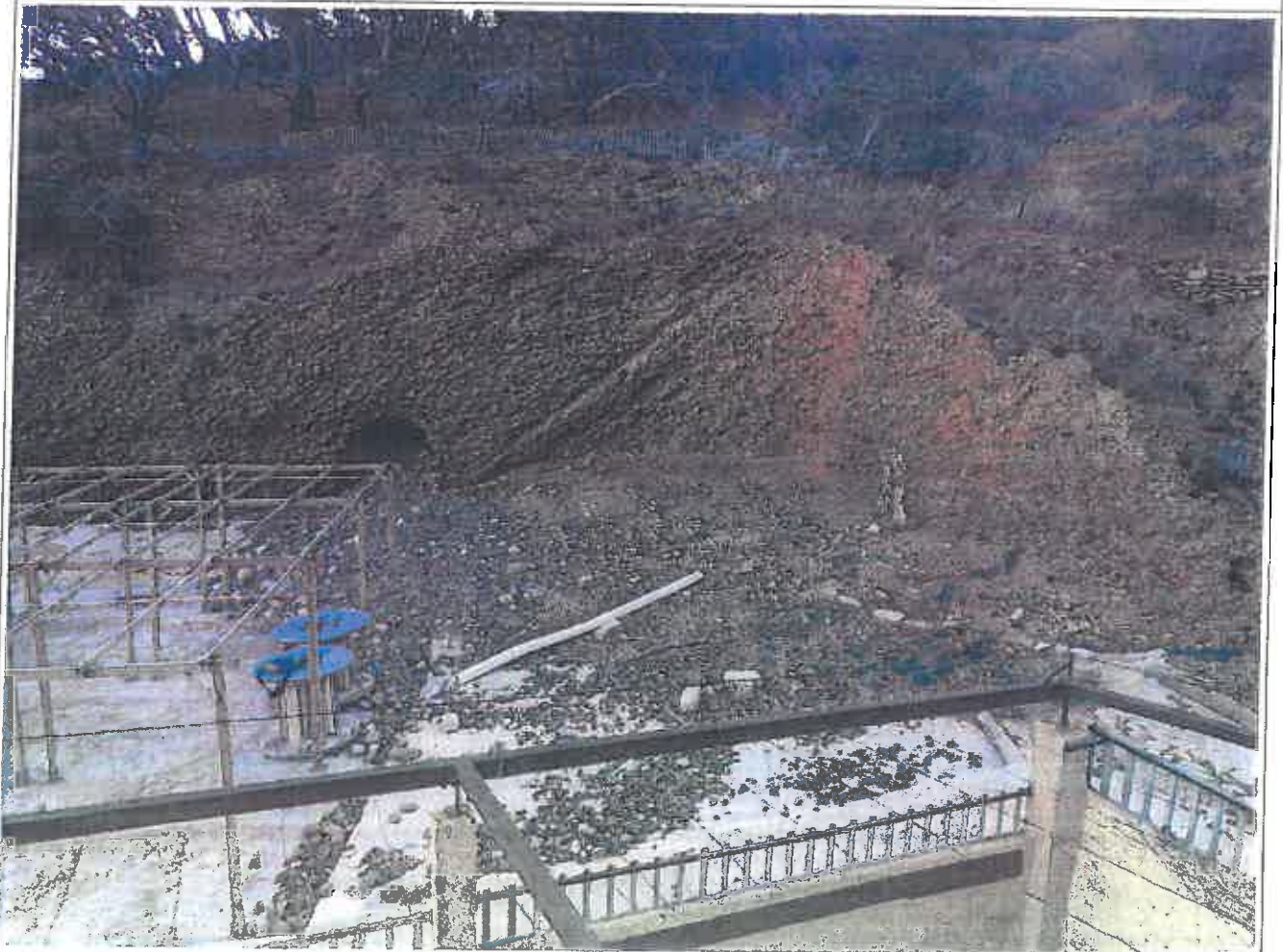
23 janvier 2018